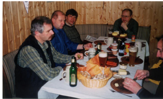
Abteilungsbesprechungen 2003 / 2005