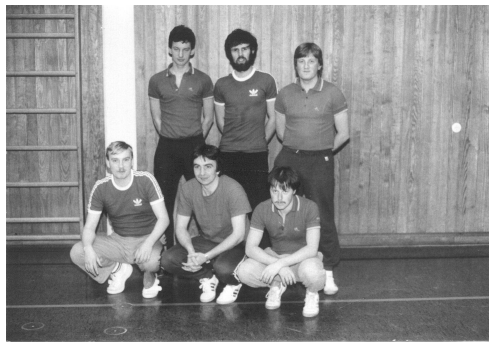
2. Herrenmannschaft 1986

Einige Mannschaftsbilder (leider nur von den Herren)