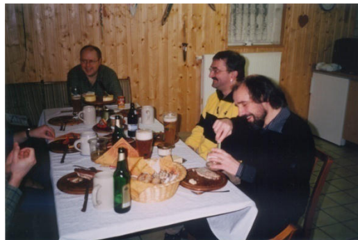
18. Juli 2014