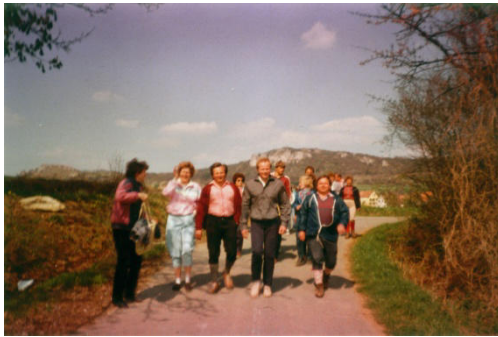
DJK Wanderung 1982