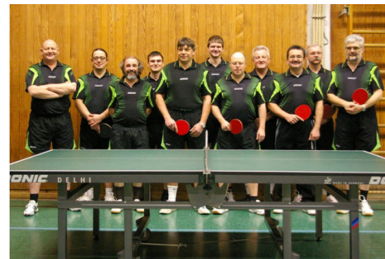
Aktive Herren 2012