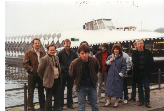
Berlin Fahrt 1985