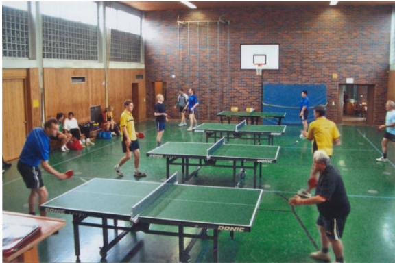
2006 60 Jahre DJK-TSV Pinzberg

... die Vereinsfreundschaften ... gemeinsame Treffen in Pinzberg eingeschlossen