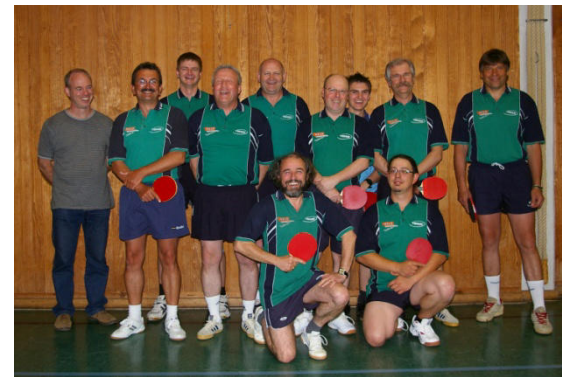
Aktive Herren 2009